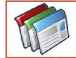
SENEL Bewerbungsprofil Deutsch