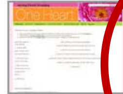
Spring Floral Wedding Instructional